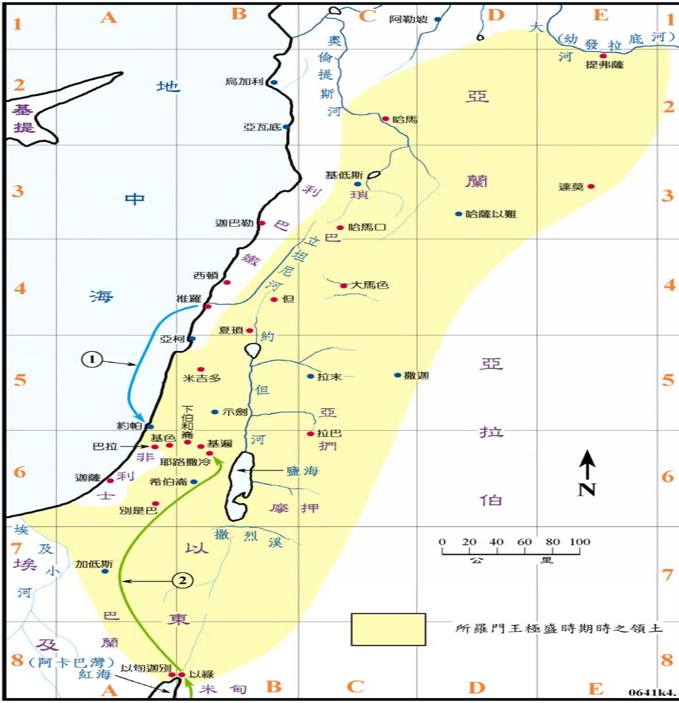
所羅門王極盛時期時之領土